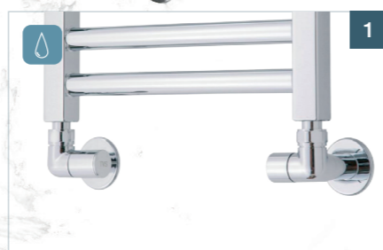
Manuelt reguleret vinkelventilsæt med afdækninger

Fremløbsventil + afspærre-/begrænserventil. Der medfølger desuden tilsvarende nippelrørsafdækninger med rosetter, lige til at montere. Det betyder færdigt arbejde, der ser godt ud.