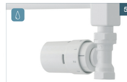
Ligeløbsventil med returtermostat