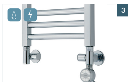
Manuelt regulerede vinkelventilsæt til kombidrift incl. afdækninger

VIGTIGT – Når man skifter til el-drift (tænder for varmelegeme) så skal man lukke for ventilen i den ene side af radiatoren (kun den ene side). Ellers vil man opvarme hele sit anlæg med el.